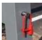
Fermeture cadenas clé triangle