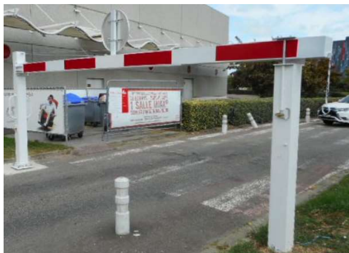
Demi portique tournant Le Majeur XXXXL