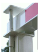
Fermeture sur poteau de