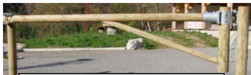
Modèle Castellane à sceller