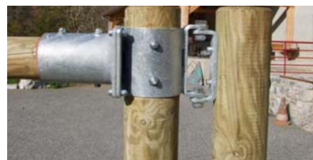
Détail Charniere pivotante