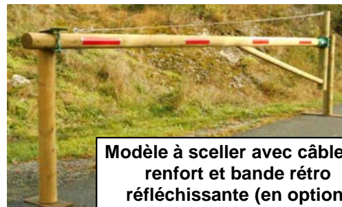
Modèle à sceller avec câble de renfort et bande rétro réfléchissante (en option)