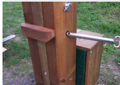
Blocage de la barriere

Nous consulter Le cout de transport dépend des quantités et du département de livraison.