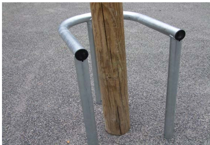
Etrier 3 pieds Idaho