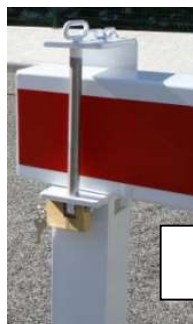
Détail fermeture cadenas Titan