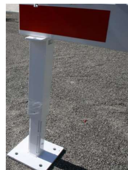
Poteau réglable en hauteur