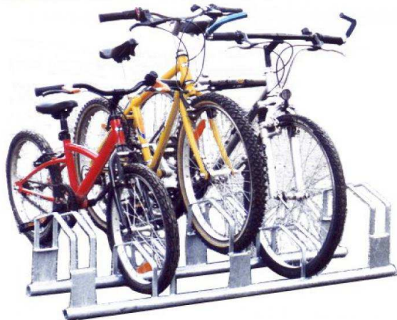
Base cycle 5 places galva

Nous consulter Le cout de transport dépend des quantités et du département de livraison.