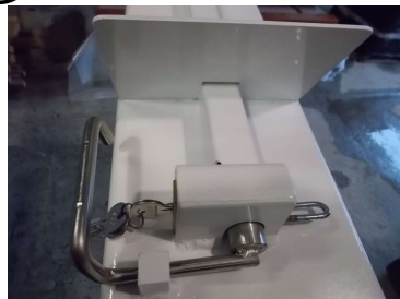
Système de fermeture sécurisée