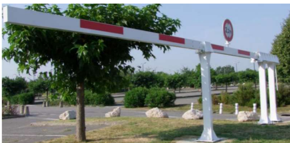
Portique coulissant manuel