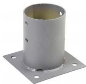
Platine pour poteau