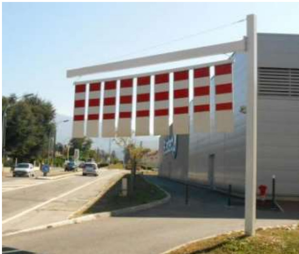
Potence fxe Ariège