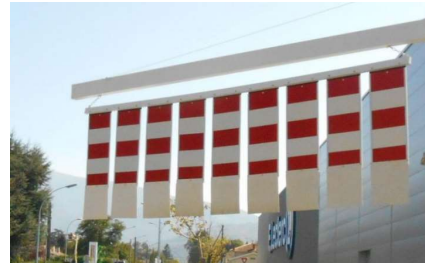
Bavette avec lames caoutchouc