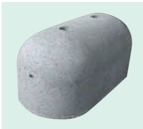
BORNE DE PROTECTION