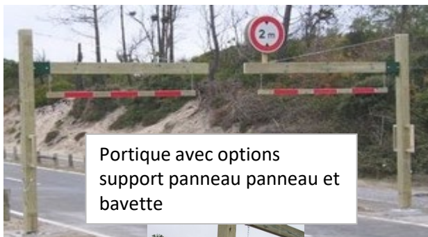
Portique avec options support panneau panneau et bavette