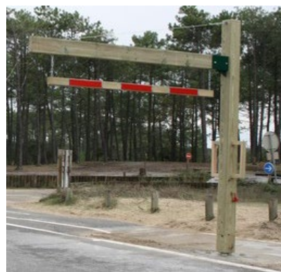
Potence avec option bavette simple