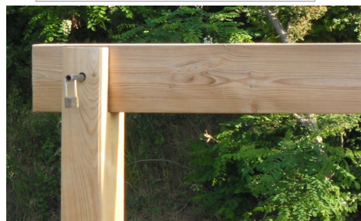
Lisse amovible par système de tige traversante et cadenas EN OPTION