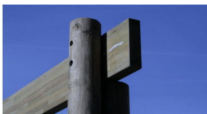
Détail fixation lisse