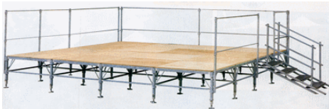
Podium partie basse

- Fabricant - Nous ne faisons pas de location.