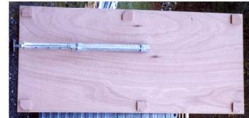
Plancher 3 plis 2x1m