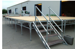
Escalier avec G.C