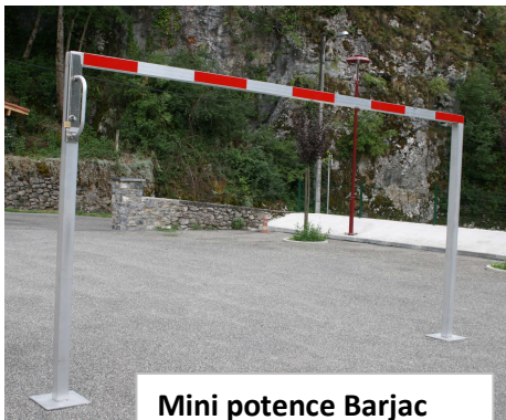
Mini potence Barjac