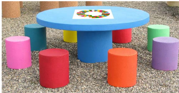
Finition couleur peint