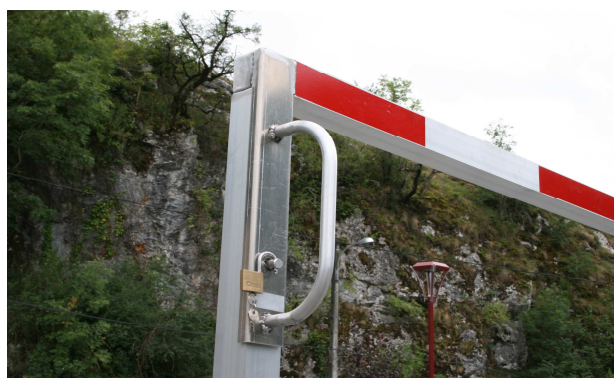
Système de fermeture