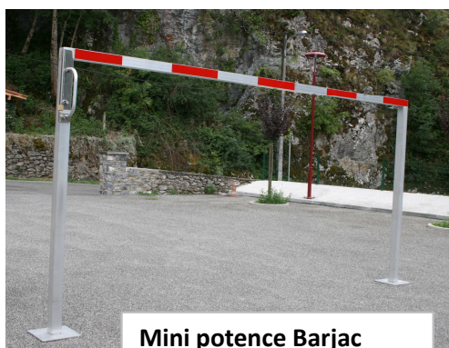
Mini potence Barjac