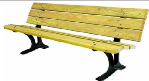
Banc en pin traité