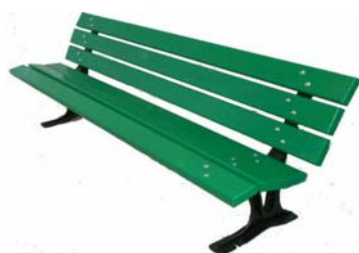
Banc lames peintes