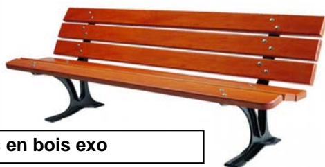
Banc en bois exo