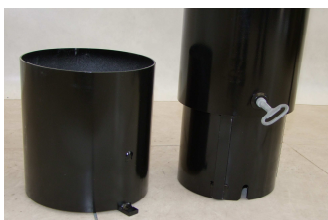
Fourreau à fermeture par clé