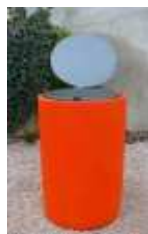
Peint avec option couvercle