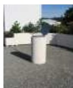
Crépi sable avec couvercle