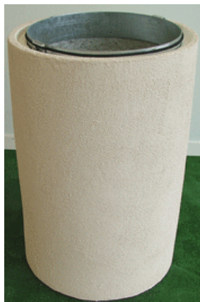
Modele crépi sable