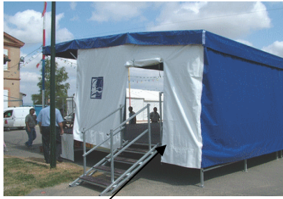
Podium 8x6m Garonne Louge