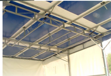
Détail toiture renforcée