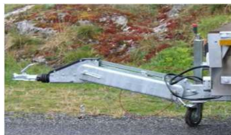
Timon articulé à Boule ou anneau