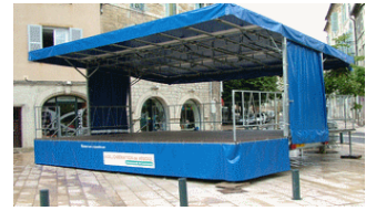
Détails cotés relevables