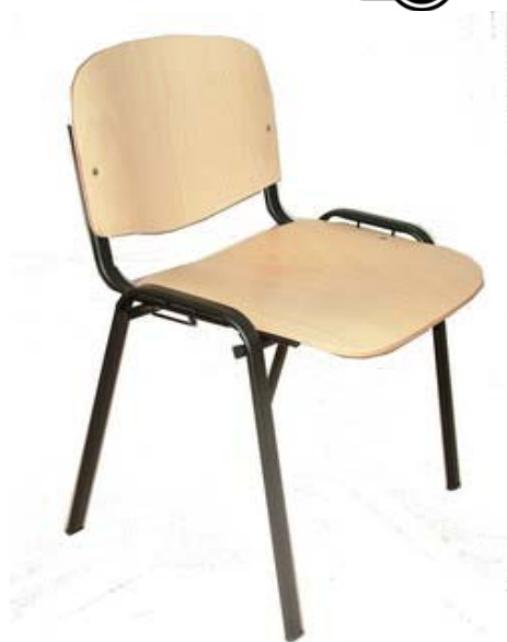
Chaises empilables Saletta