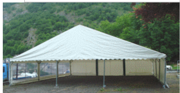
Tente 10 m de pignon

Le cout de transport dépend des quantités et du département de livraison.