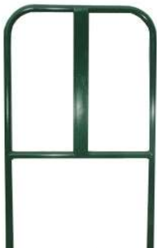
Arceau support panneau laqué L. 0,83m