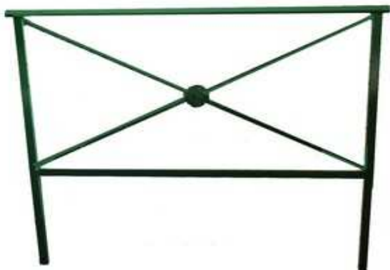
Sost sans grille à sceller