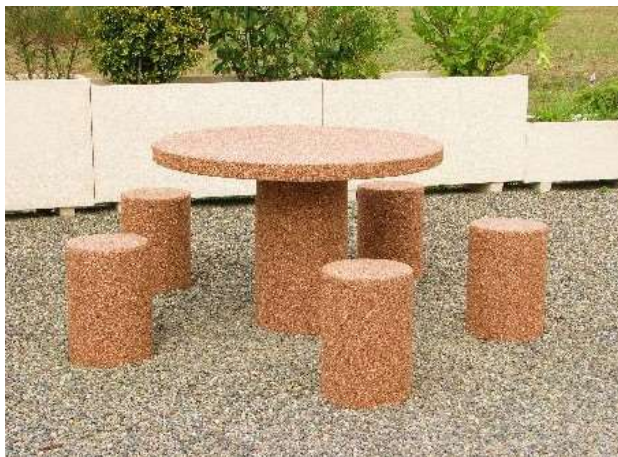
Finition gravillons lavés