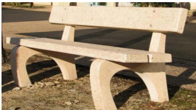
Banc béton Oméga

Nous consulter Le cout de transport dépend des quantités et du département de livraison.