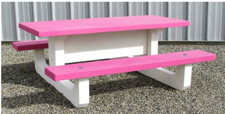
Finition mixte (béton blanc/couleur)