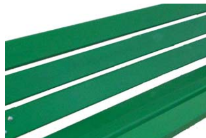
Lame laquée Ral à préciser :