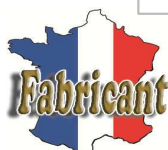
Modèle avec pied