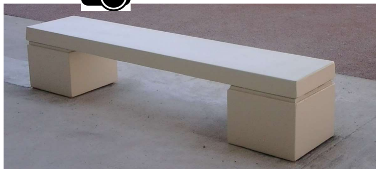
Finition béton blanc naturel