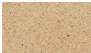
Aspect pierre ivoire