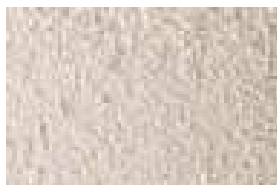
Crépis ton sable