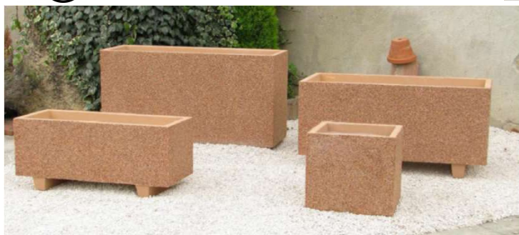
Finition gravillons lavés