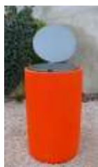
Peint avec option