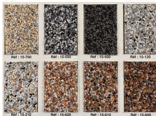
Finition gravillons lavés