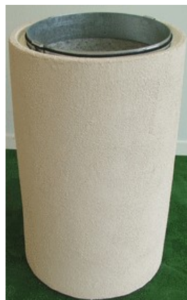
Modele crépi sable