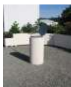
Crépi sable avec