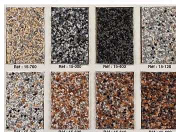
Finition gravillons lavés