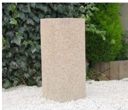
Modèle gravillons lavés