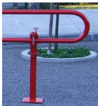
Pied de soutien