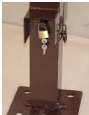
Systeme fermeture avec cadenas