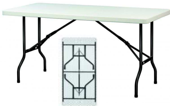
Table pliante Regina