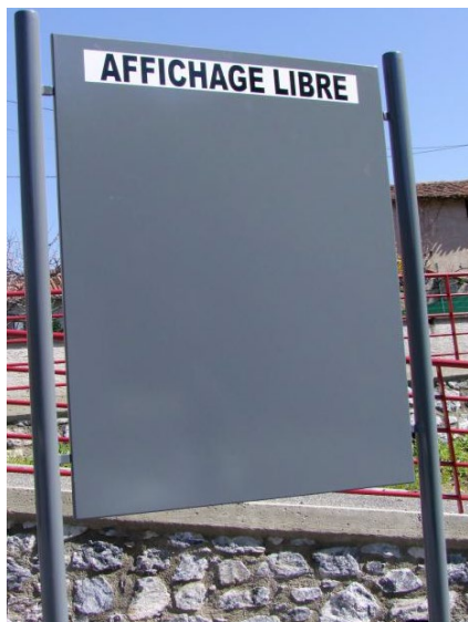
Panneau affichage libre