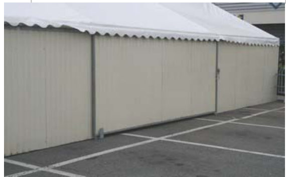
Portail coulissant 4m