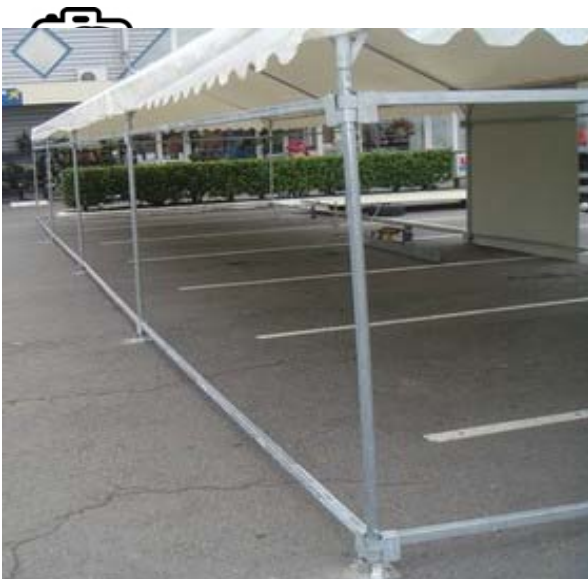
Stocktente ossature acier