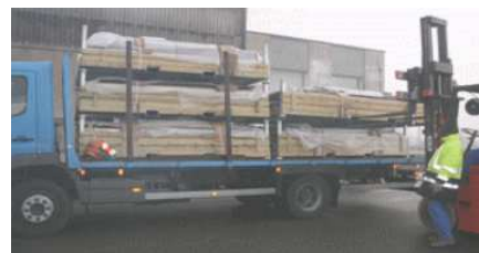
Transport par 3 unités empilées