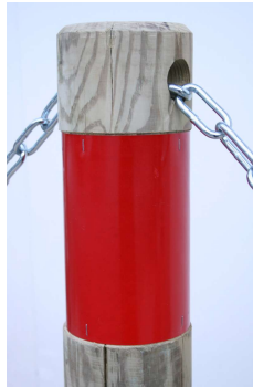
Perçage passage chaîne

Nous consulter Le cout de transport dépend des quantités et du département de livraison.