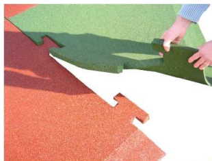
MONTAGE TYPE PUZZLE