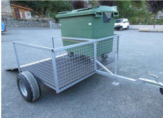
photo non représentée