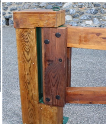
Poteau principal métallique avec