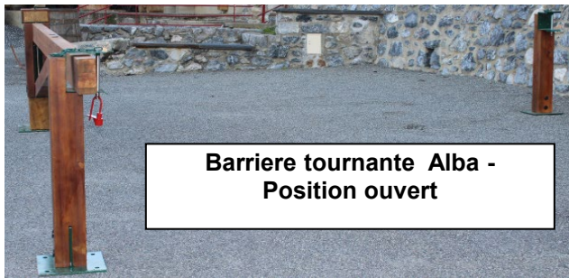
Barriere tournante Alba - Position ouvert