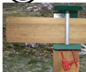
Tige traversante et cadenas