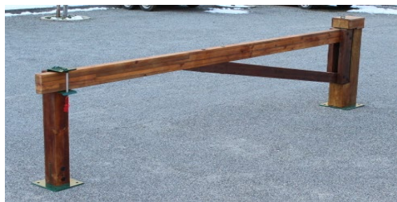
Barriere tournante Alba -Position fermée