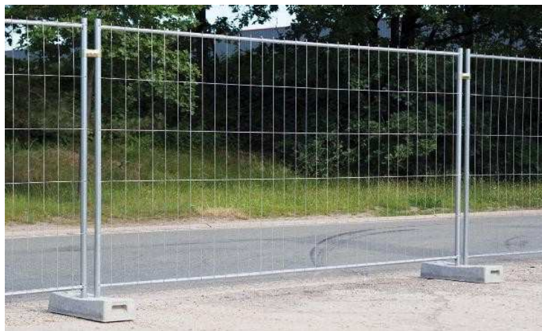
Cloture de chantier