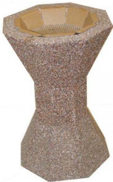
Modele gravillons lavés

Béton de granulats calcaire et marbres finition pierre naturelle avec revêtement hydrofuge et anti-graffiti. Aspect pierre de pays