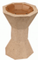
Aspect pierre ivoire